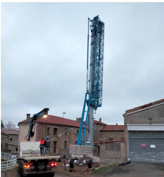
L'installation de la grue