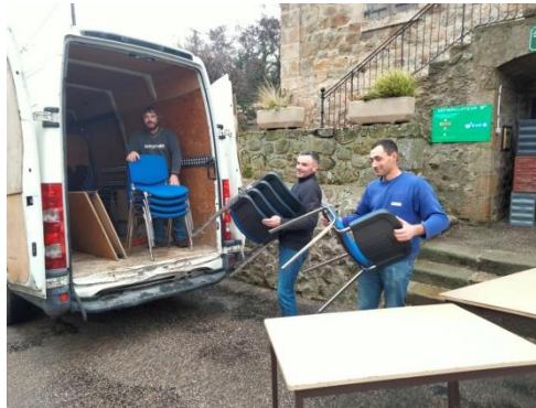
Vos élus au travail

Durant toute cette période, les services de la mairie continueront de fonctionner dans les mêmes conditions qu'aujourd'hui dans l'ancien foyer des jeunes à l'entrée du village. L'adresse postale, le téléphone et l'adresse mèl restent inchangés.